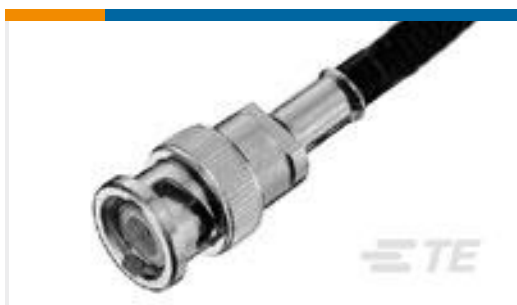
TE 产品编号2-330358-2 BNC PLUG KIT