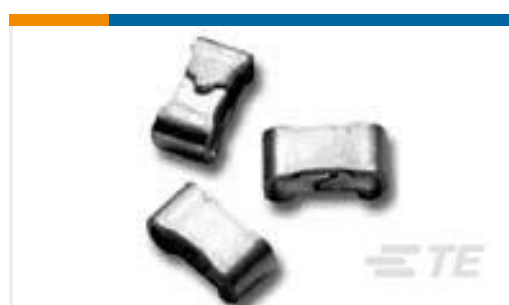
TE 产品编号1625854-3 0603 PROBE PAD