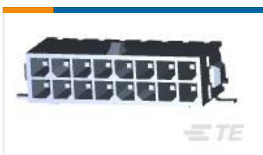
TE 产品编号4-794627-6 16P MICRO MNL ASSY,RA,SMT,LF