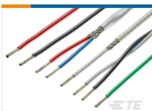
TE 产品编号379108-000 44A7620-22-9/5-9