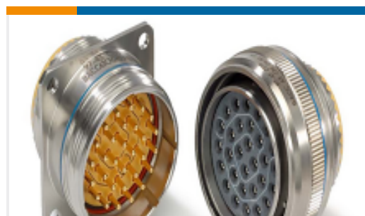
TE 产品编号 ZPF000000000033725 983-0SE 18-08 PN-L