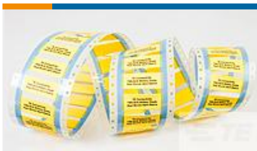
TE 产品编号 186782-000 TMS-SCE-2-1/4-2-0-4