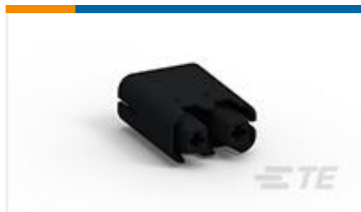
TE 产品编号 1587977-2 INNER HOUSING, PLUG, HVA280-2PHM, PASS T