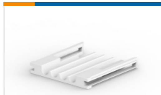
TE 产品编号 1600902-1 INSERT MBXL 2 SIGNAL LOCK 4POS