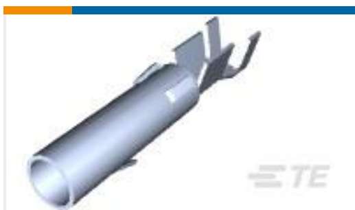
TE 产品编号 170147-1 MATE-N-LOK SOCKET 2