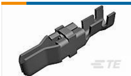
TE 产品编号66254-5 MALE TYPE XII GROUND CONTACT