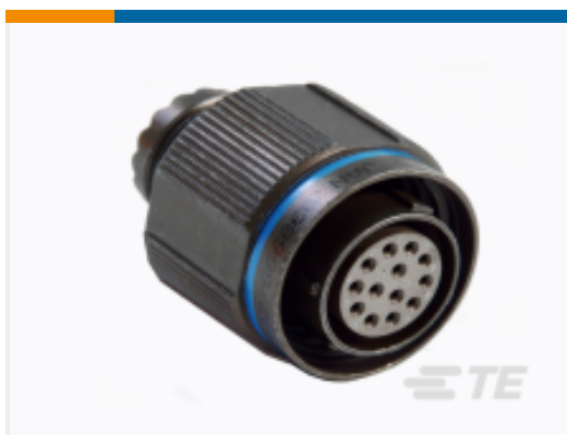
TE 产品编号 YACT26JB05JAV00100 STRAIGHT PLUG