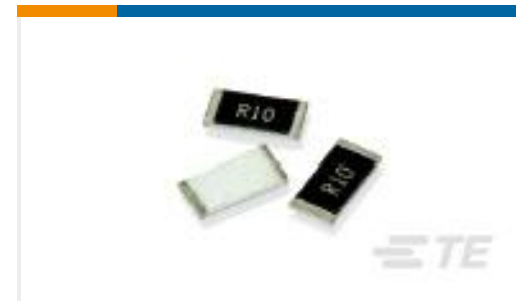
TE 产品编号 2-1879461-7 RL73H 2A R16 1% 1K RL