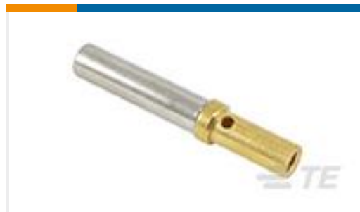
TE 产品编号 0462-201-1631 SOC, SOLID, SIZE 16, 16-20AWG, AU