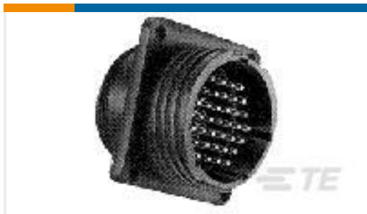
TE 产品编号 206151-1 23-37 RECEPT STD SEX