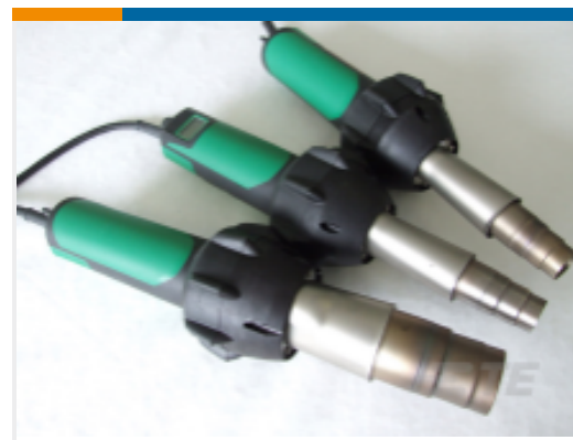
TE 产品编号 EG1114-000 CV1981-ST-230V1600W-EU