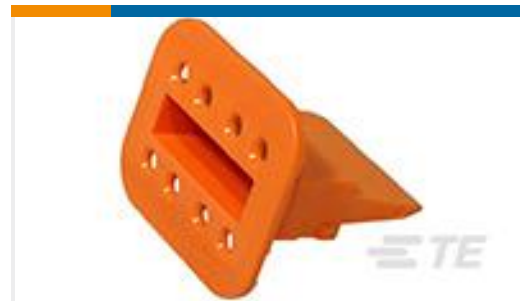
TE 产品编号 W8S WEDGE LOCK, 8P, PLG, ORG, STD, DT