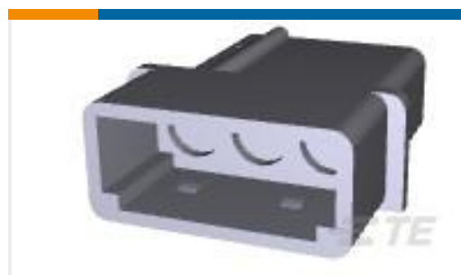
TE 产品编号 1-480305-0 03P CMNL CAP HSG F/H NATL