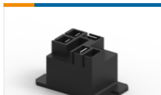
TE 产品编号 1649341-2 T9CP1A54-240