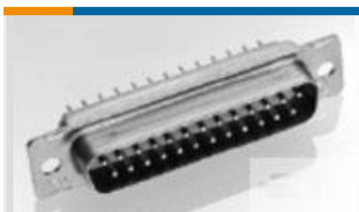
TE 产品编号 1757820-8 AMPLIMITE,ASY,RCPT,STD,109,ZN,3, CT