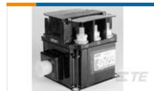
TE 产品编号1616005-1 B4291 (FAA/PMA)=RELAY