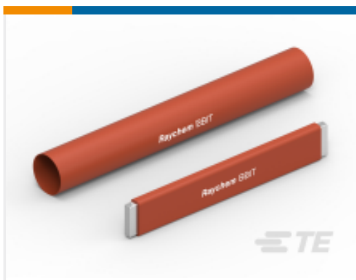
TE 产品编号560936-000 母线绝缘管高达 35 kV