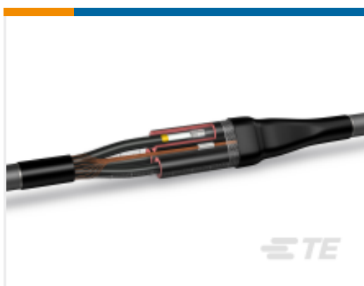
TE 产品编号A69078-064 POLJ-12/3X70-150