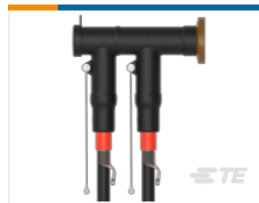
TE 产品编号CM0097-005 RSTI-CC-5854