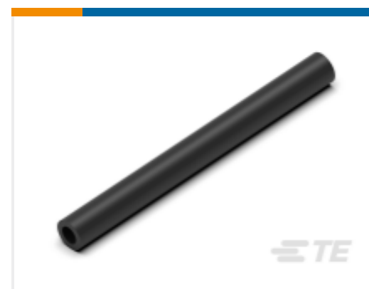
TE 产品编号CN5946-000 EN-CGAT-6/2-0-1200