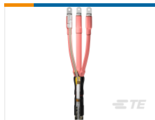
TE 产品编号C47372-064 GUST-12/25-50/800