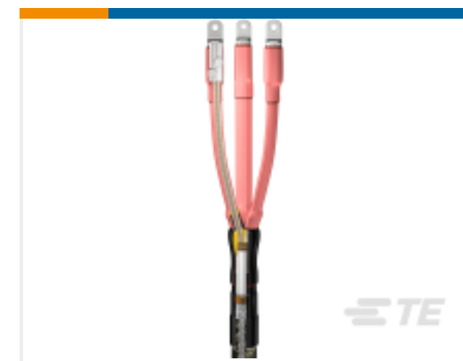
TE 产品编号A31452-070 GUST-12/70-120/800-L12