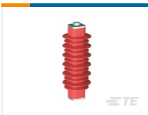
TE 产品编号EN6028-000 HDA-33M-B3-NFF