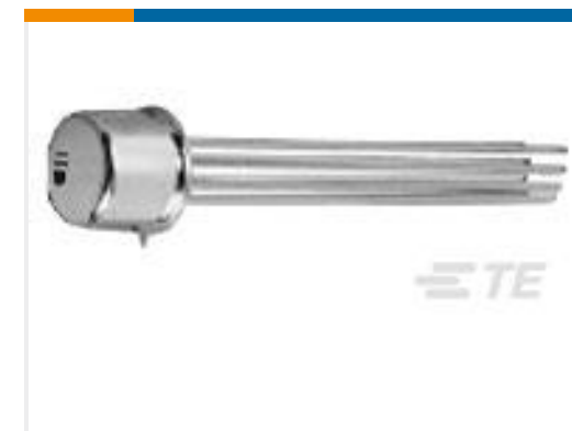
TE 产品编号1617119-5 J1MAW-18XP = M39016/7-021P