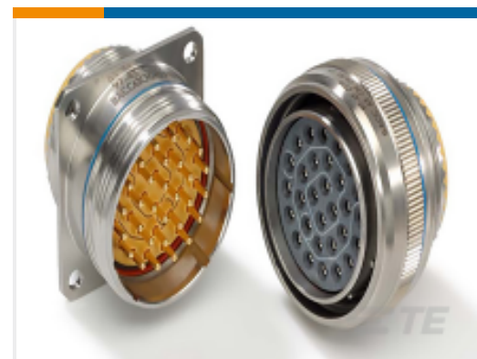
TE 产品编号ZPF000000000007174 983-ORS 08-98 PN