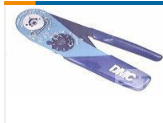
TE 产品编号 601966-1 CRIMPING TOOL M22520/2-01