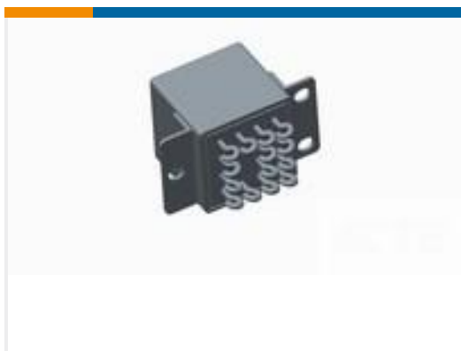
TE 产品编号9-1617807-8 TD228-9002S=TDFO 90 SEC M83726 /28-9002S