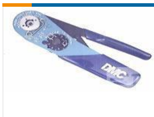
TE 产品编号 601966-1 CRIMPING TOOL M22520/2-01