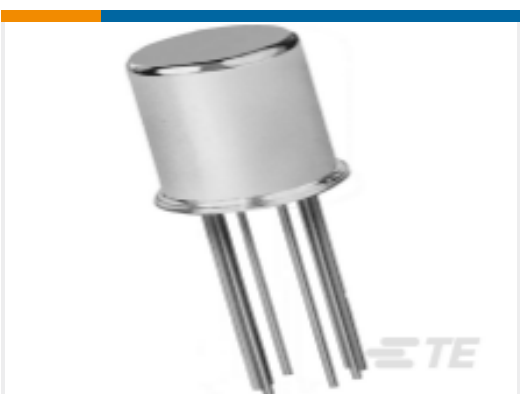
TE 产品编号 1617164-7 JMACT-5XL = M28776/1-025L