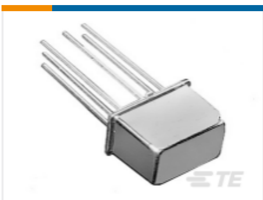
TE 产品编号 1617147-5 JMGAP-26P = M39016/17-030P