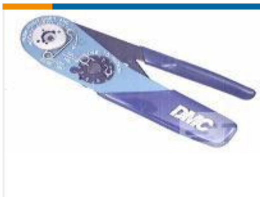
TE 产品编号 601966-1 CRIMPING TOOL M22520/2-01