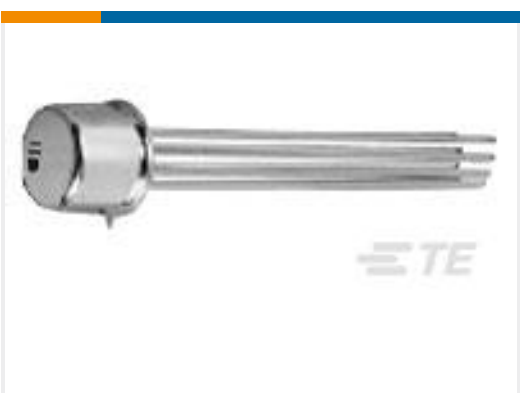
TE 产品编号 1617119-5 J1MAW-18XP = M39016/7-021P