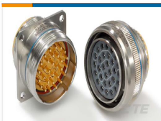
TE 产品编号 ZPF0000000000007174 983-ORS 08-98 PN