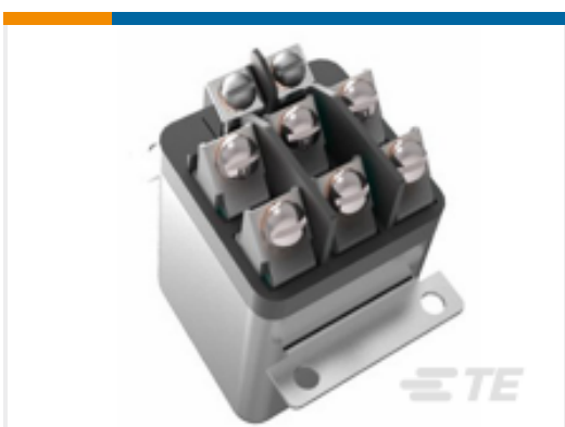
TE 产品编号 1617807-5 FC-335-SY8 = RELAY, 3PST