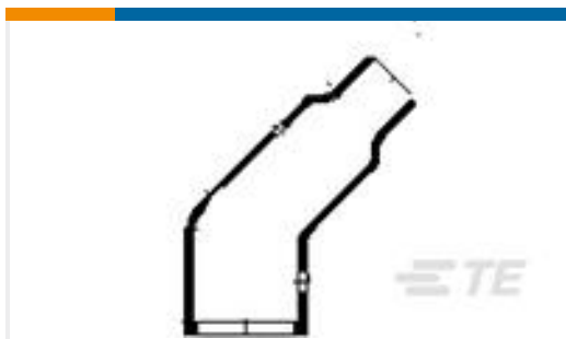
TE 产品编号642427-000 242A312-12-03-0