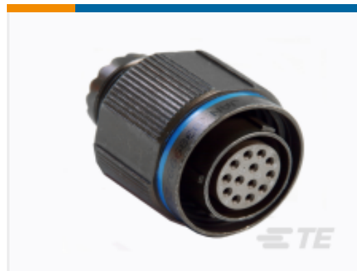
TE 产品编号 CAT-D38999-ACT7V Straight Plug D38999, A98 Insert