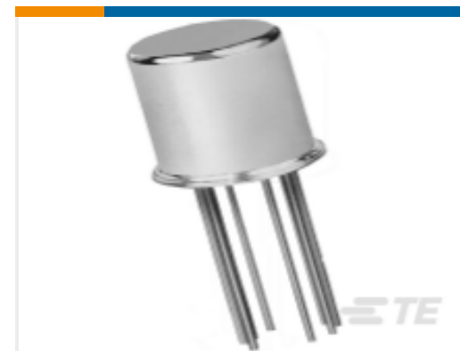
TE 产品编号1617164-7 JMACT-5XL = M28776/1-025L