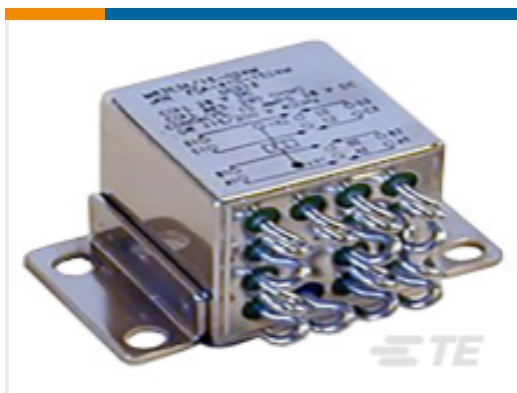
TE 产品编号1617820-4 TD228-2403P 240SEC M83726/28-2403P