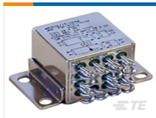
TE 产品编号4-1617819-1 TD228-4502S M83726/28-4502S