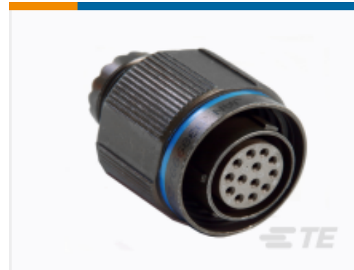
TE 产品编号YDTS26W13-35SEC001 PLUG ASSY