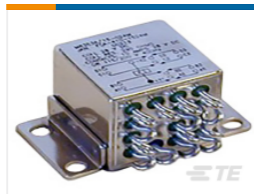
TE 产品编号4-1617819-2 TD231-5002S M83726/31-5002S