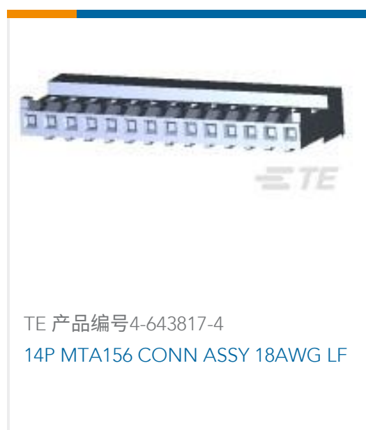
TE 产品编号4-643817-4 14P MTA156 CONN ASSY 18AWG LF