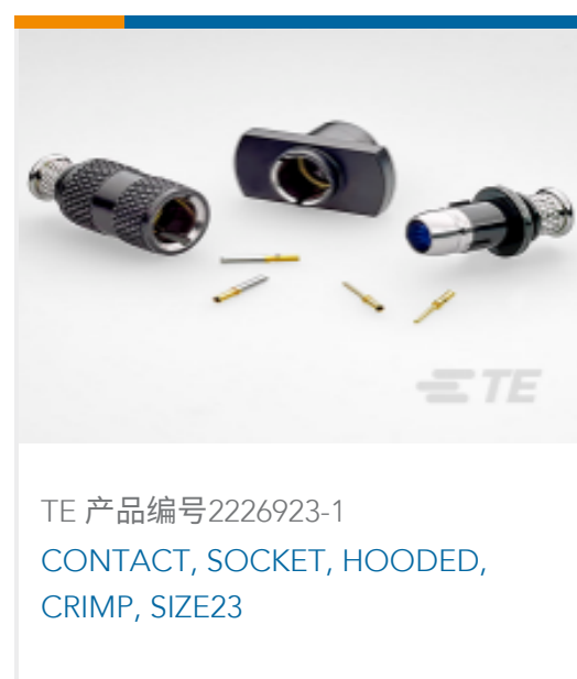
TE 产品编号2226923-1 CONTACT, SOCKET, HOODED, CRIMP, SIZE23