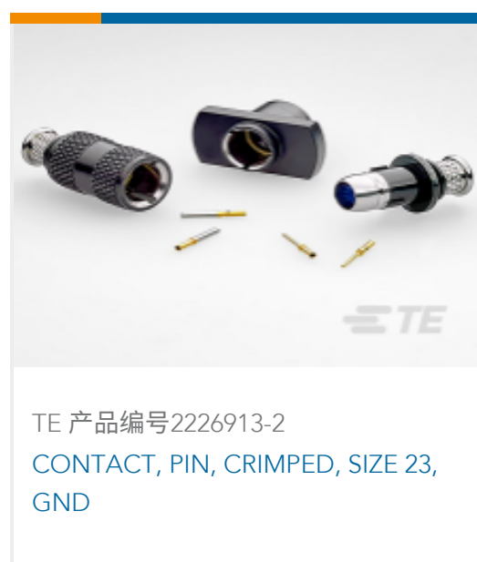
TE 产品编号2226913-2 CONTACT, PIN, CRIMPED, SIZE 23, GND