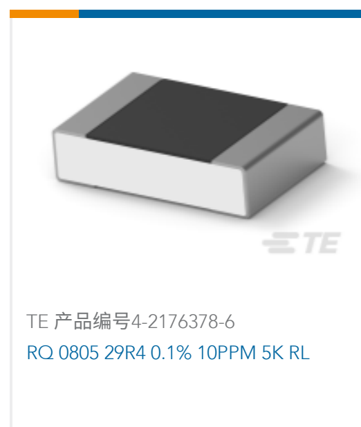
TE 产品编号4-2176378-6 RQ 0805 29R4 0.1% 10PPM 5K RL