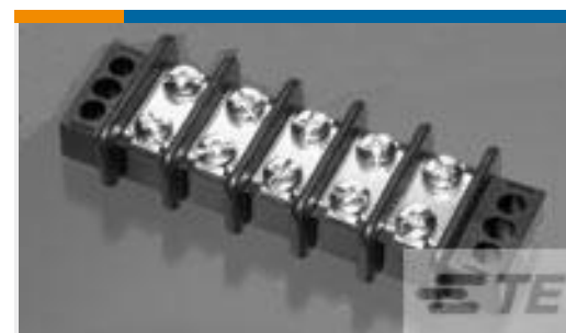
TE 产品编号1546307-3 3P .374" DR BARRIER,W/WASHER