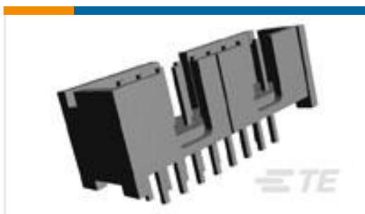
TE 产品编号103308-1 010 LOPRO HDR SP 15DP