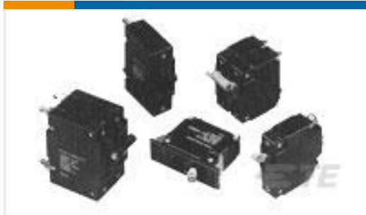
TE 产品编号 8-1393254-7 W92-X113-20=M6/M7/M9/W6/W7