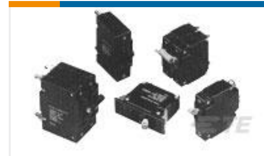
TE 产品编号 6-1393254-3 W92-X1110-20=M6/M7/M9/W6/W7