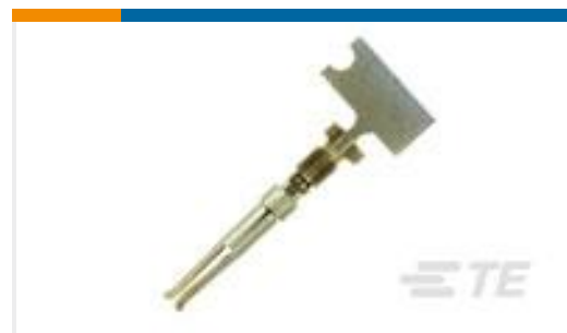
TE 产品编号1658537-4 SOCKET CONT DUPL PLT LP HD-20