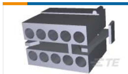
TE 产品编号1-480285-0 10P CMNL PLUG HSG M/M NATL