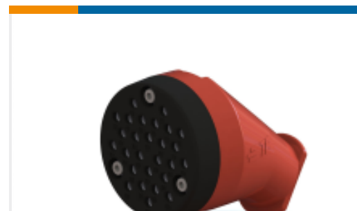
TE 产品编号YE-UC-212095A-0000 PLUG, COMMUNICATION COMMUTER