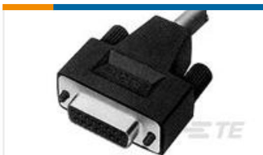
TE 产品编号1658654-1 KIT,HDP-20,ENCLSUR,RCPT,SIZE 1