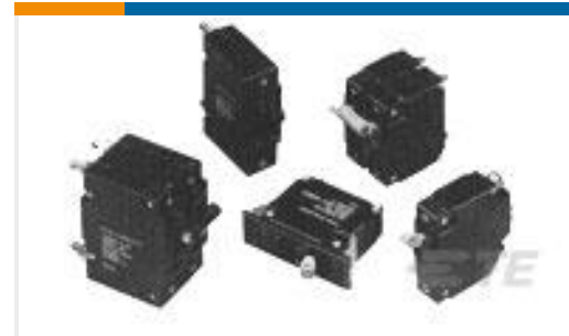
TE 产品编号 7-1393254-2 W92-X112-20=M6/M7/M9/W6/W7