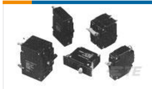
TE 产品编号 4-1393254-4 W91-X152-20=M6/M7/M9/W6/W7