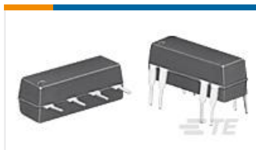
TE 产品编号1393771-5 JWD-107-5=REED RELAYS