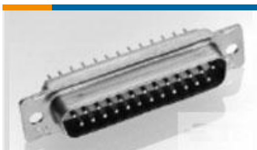
TE 产品编号1757820-5 AMPLIMITE,ASY,RCPT,STD,109,ZN,5