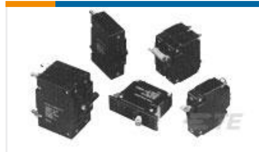
TE 产品编号 1-1393254-8 W91-X1110-20=M6/M7/M9/W6/W7