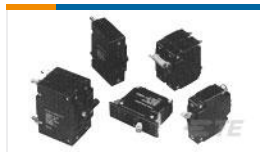
TE 产品编号1393255-8 W93-X112-30=M6/M7/M9/W6/W7