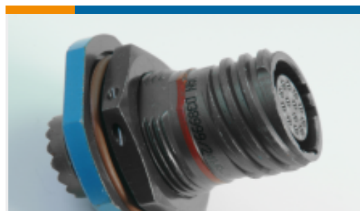
TE 产品编号YDTS24W17-06SNV001 RECP ASSY