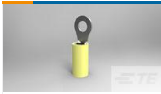
TE 产品编号 2-36161-3 TERMINAL,PIDG R IR 12 10