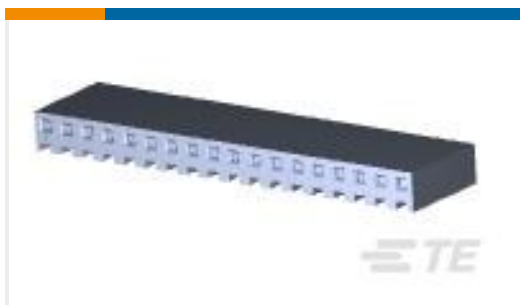
TE 产品编号1-640251-8 18P SL156 HSG W/O LCK RAMP