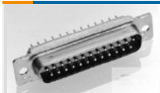
TE 产品编号1757819-9 AMPLIMITE,ASY,PLUG,STD,109,ZN,4, CT