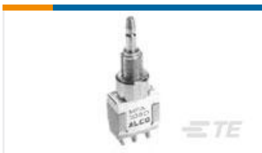
TE 产品编号2-1437567-9 MPA106F=SWITCH P/B MOM SPDT