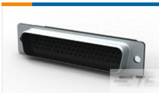
TE 产品编号1658674-1 HDP-22,PLUG,SIZE 5,78 POSN