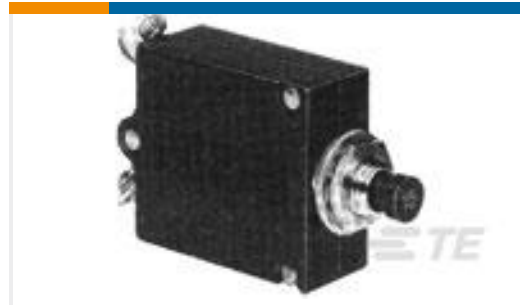
TE 产品编号 1-1423678-9 W23-X1A1A-15=CKTBKR,THERM,PB, SCW,BUSH