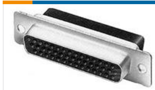
TE 产品编号1658685-1 HDP-22,RCPT,SIZE 5,78 POSN