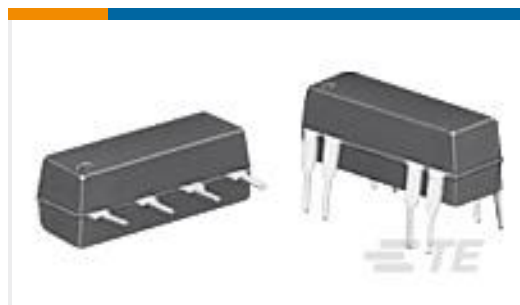
TE 产品编号1393771-4 JWD-107-3=REED RELAYS