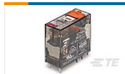
TE 产品编号1887112-3 XT374LB2