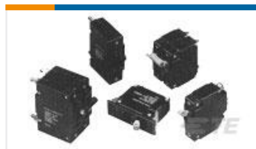
TE 产品编号1393255-8 W93-X112-30=M6/M7/M9/W6/W7