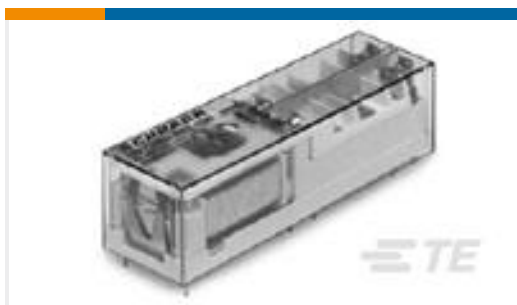
TE 产品编号1415015-1 SR6A4024 - V23050-A1024-A533