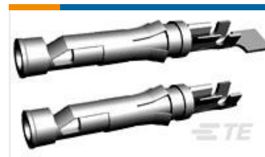
TE 产品编号1-66105-8 III+ SKT,24-20,30AU/FL,SMPACK