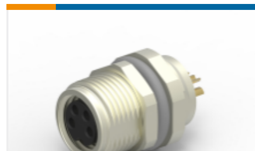
TE 产品编号T4031017041-000 M8.FMLE.PNLREAR.4POS.STR