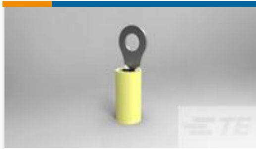
TE 产品编号 2-36161-3 TERMINAL,PIDG R IR 12 10