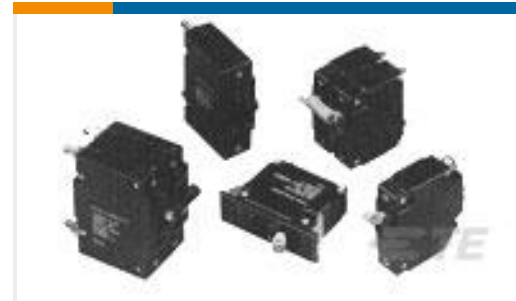
TE 产品编号 6-1393254-3 W92-X1110-20=M6/M7/M9/W6/W7