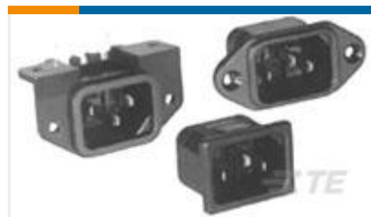
TE 产品编号1609133-1 6ESRF-3=F6988