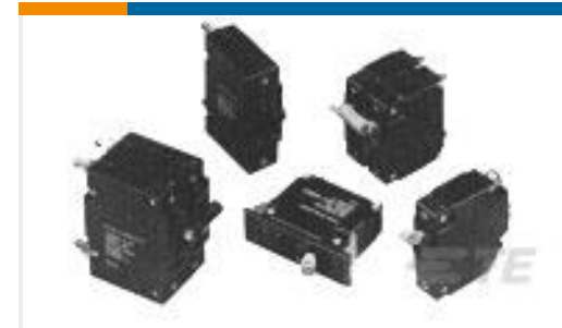
TE 产品编号 5-1393254-9 W92-X110-20=M6/M7/M9/W6/W7