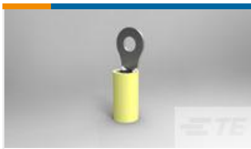
TE 产品编号 2-320568-2 TERM, RT, PIDG IR, 12, #8