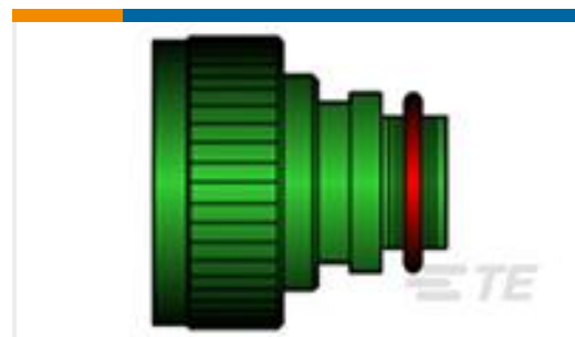
TE 产品编号150211-000 TXR54AB00-1206AI