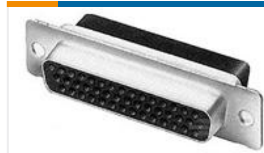
TE 产品编号1658685-1 HDP-22,RCPT,SIZE 5,78 POSN