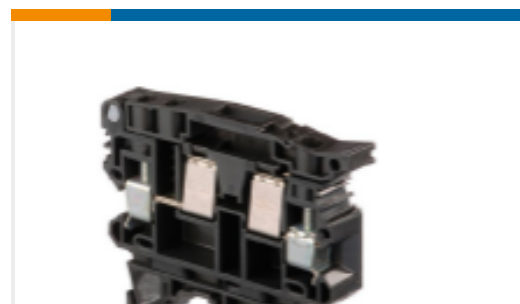
TE 产品编号1SNA199095R1300 ML10/13.SF