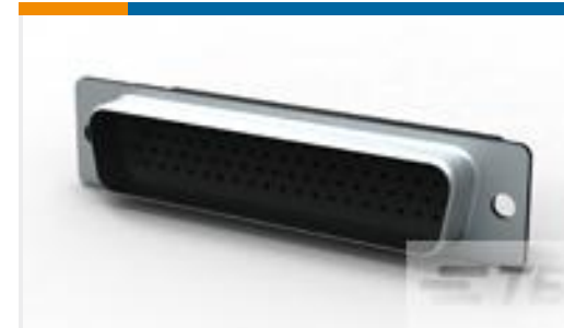
TE 产品编号1658674-1 HDP-22,PLUG,SIZE 5,78 POSN