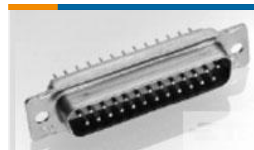
TE 产品编号204501-5 AMPLIMITE,ASY,PLUG,90,1