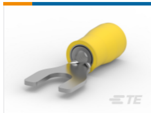
TE 产品编号 35152 TERMINAL,PIDG SPD 12-10 8