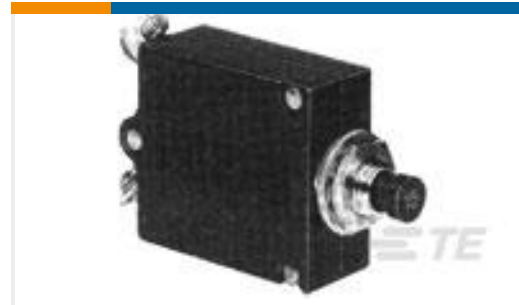
TE 产品编号 6-1393246-4 W23-X1A1G-1=W23/W31