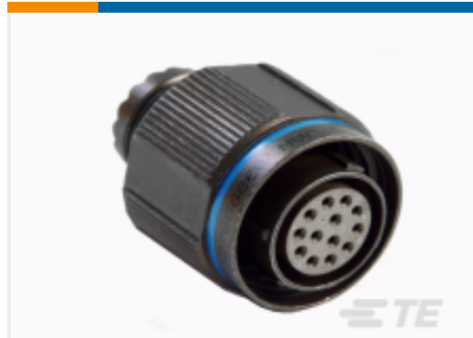
TE 产品编号DTS26W15-97PN PLUG ASSY