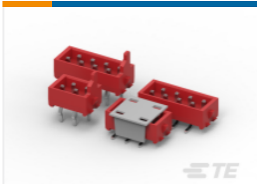
TE 产品编号215464-8 板公端连接器