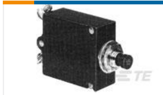
TE 产品编号 7-1393246-0 W23-X1A1G-3=W23/W31