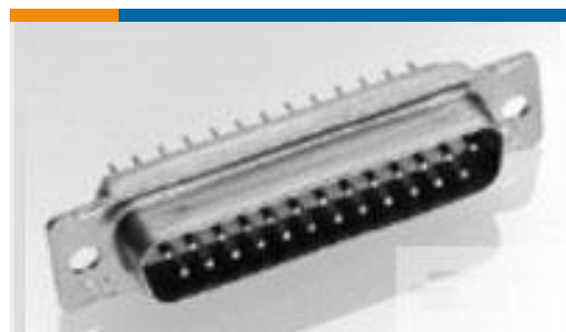
TE 产品编号1757824-9 AMPLIMITE,ASY,RCPT,STD,90,ZN,3,CT