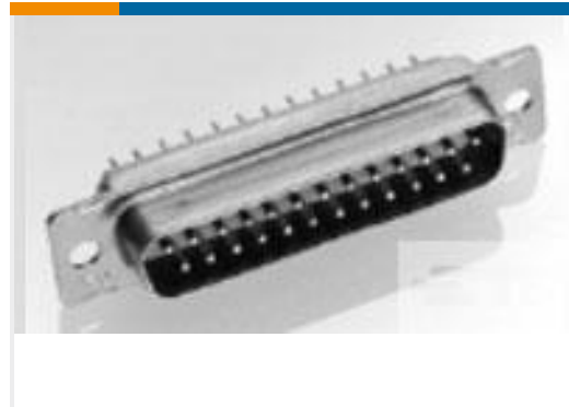
TE 产品编号204521-2 AMPLIMITE,ASY,PLUG,STD,90,5