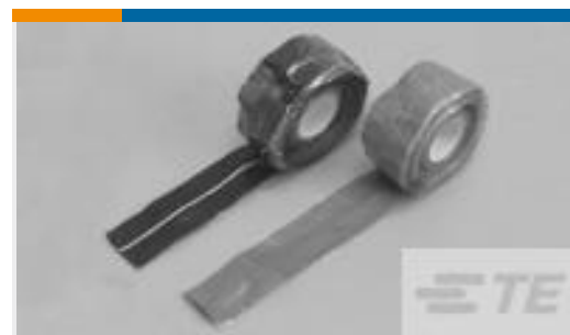
TE 产品编号1-608036-4 SILICONE FUSION TAPE,1"X15'