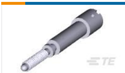
TE 产品编号203618-1 MALE J.S. ASSY. - SHORT