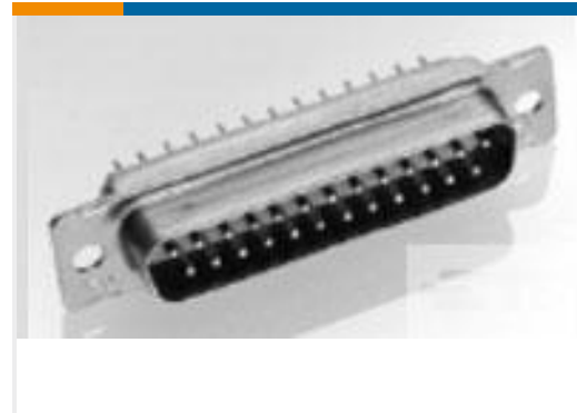
TE 产品编号1757823-5 AMPLIMITE,ASY,PLUG,STD,90,ZN,5