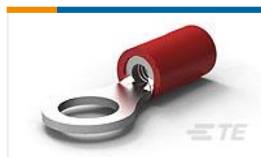
TE 产品编号130014 PG R 22-16 5MM