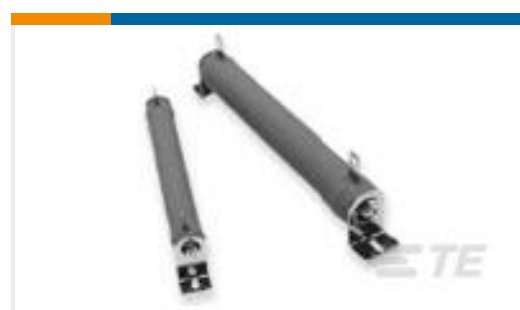
TE 产品编号1-1879452-8 TE 750W 27R 5% Bracket