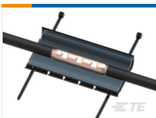
TE 产品编号CA1421-000 GELWRAP-33/10-250(B12)