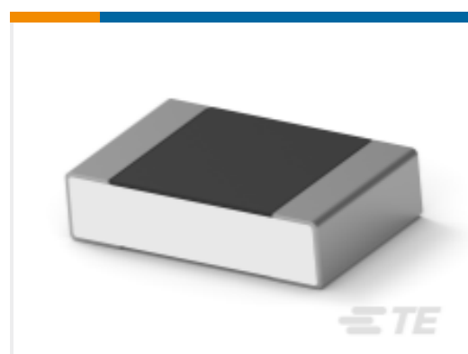
TE 产品编号1-2176378-1 RQ.0805 12R7 0.1% 10PPM 5K RL