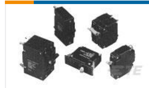
TE 产品编号 5-1393254-9 W92-X110-20=M6/M7/M9/W6/W7