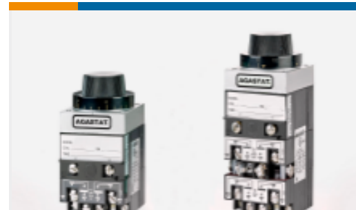
TE 产品编号1755170-1 7022OCIM=RLY,STD,OFF,2P,24V,15S,I, M