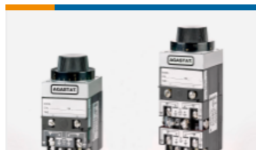
TE 产品编号7-1472995-0 7012WDS=RLY,STD,ON,2P,96V,50S,S