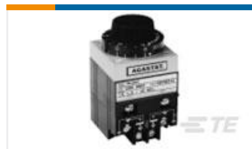
TE 产品编号6-1755142-4 7022WDIM=RLY,STD,OFF,2P,96V,50S,I, M