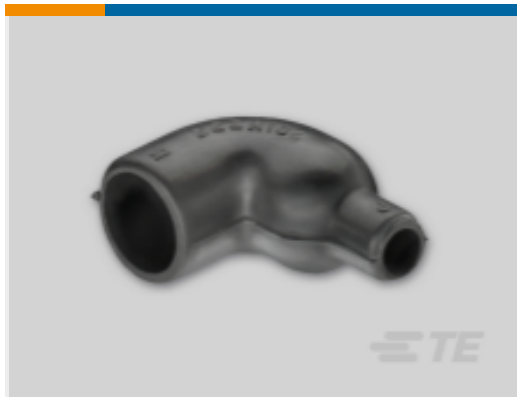
TE 产品编号 806823-000 球形热缩护套：有嘴，直角