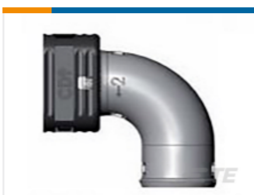
TE 产品编号 ZPF000000000102764 787-8055-30M