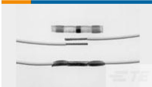
TE 产品编号F80600-000 B-152-9004