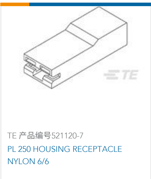
TE 产品编号521120-7 PL 250 HOUSING RECEPTACLE NYLON 6/6