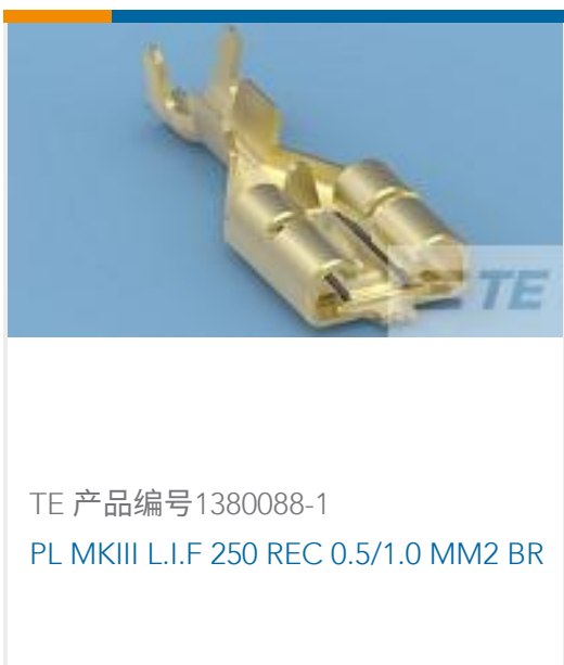
TE 产品编号1380088-1 PL MKIII L.I.F 250 REC 0.5/1.0 MM2 BR