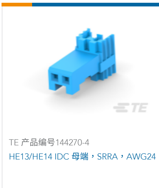
TE 产品编号144270-4 HE13/HE14 IDC 母端, SRRA, AWG24