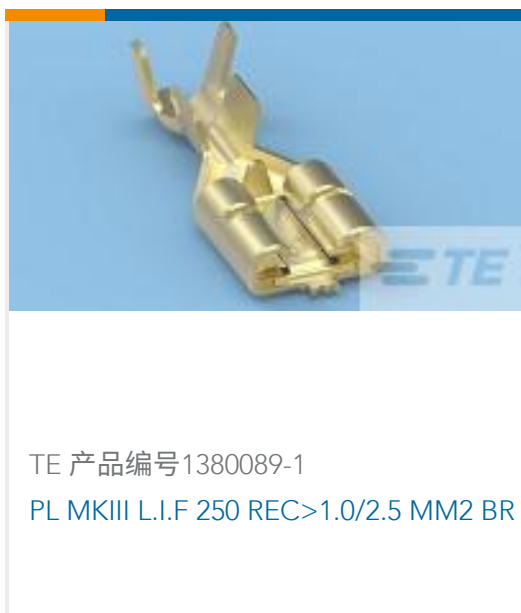
TE 产品编号1380089-1 PL MKIII L.I.F 250 REC>1.0/2.5 MM2 BR