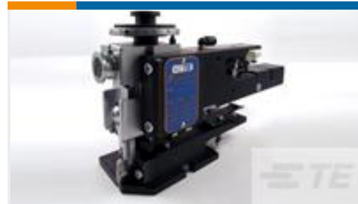
TE 产品编号2150441-2 OCEAN_2.0_Applicator-E-090F140F