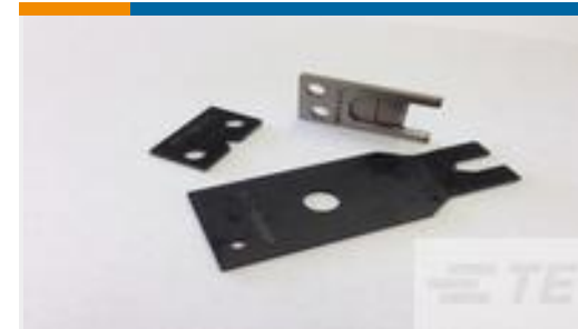
TE 产品编号454575-2 BLADE, SHEAR