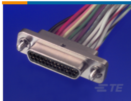
TE 产品编号2-1532176-7 M83513/04-F11C, MCKS-C2-B-37S6Q9-18.0