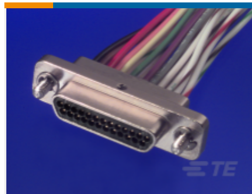
TE 产品编号2-1532184-8 M83513/03-F12C, MCKS-C2-B-37P6Q9-36.0