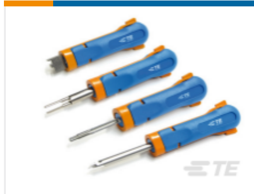
TE 产品编号265896-1 HOUSING REMOVAL TOOL