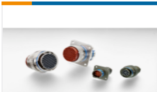
TE 产品编号YAFD57-24-19SNC012 PLUG ASSY