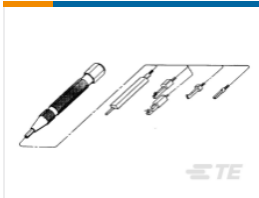
TE 产品编号265871-8 PIN REPLACEMENT TOOL