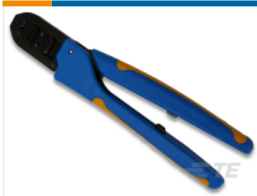
TE 产品编号2217740-1 CCII CRIMP ON REC 26-22 ASSY