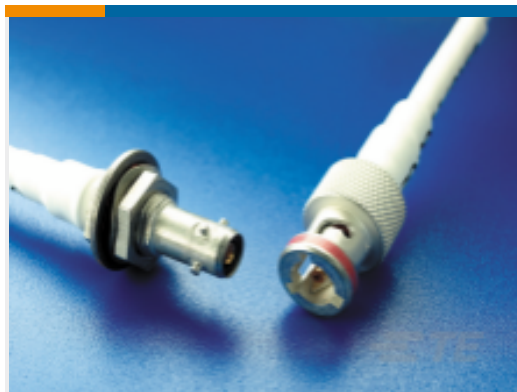
TE 产品编号497293-000 D-621-002