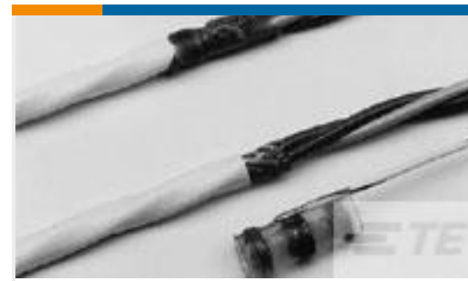
TE 产品编号672223N002 S02-08-R-5CS816