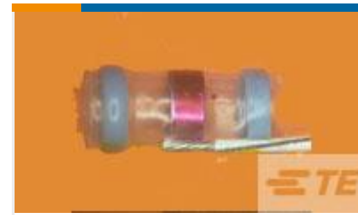
TE 产品编号932425N002 S02-08-R-6CS816