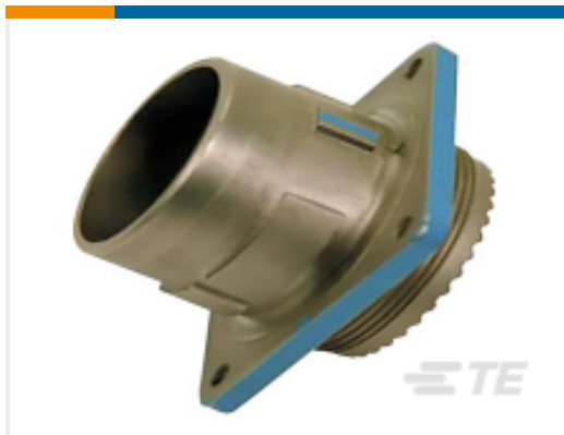
TE 产品编号YDIV40E23-21PNC009 RECP ASSY