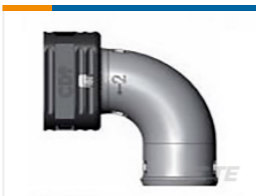
TE 产品编号ZPF000000000102764 787-8055-30M