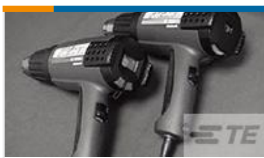
TE 产品编号 CJ2087-000 HL2010E-KIT-120V