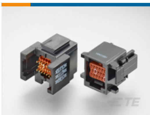
TE 产品编号ABC06N-22P IN-LINE PLUG