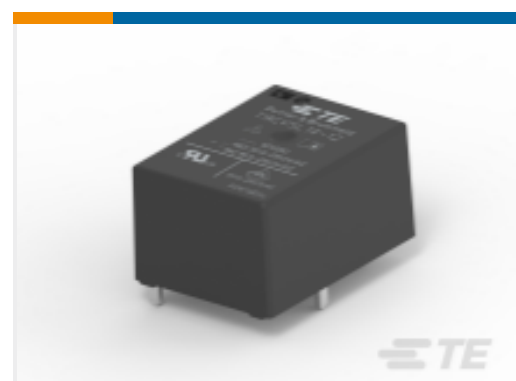
TE 产品编号1558662-4 T9GV2L14-15