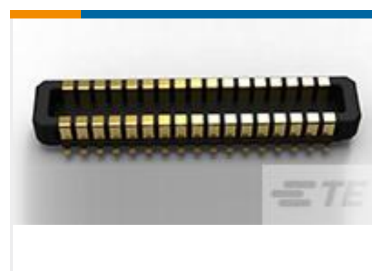
TE 产品编号2-2201196-4 0.4 STACKING CONN H0.98 PLUG ASSEMBLY