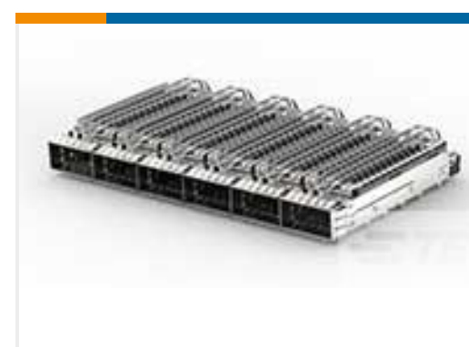
TE 产品编号2-2170708-1 CAGE ASSY, 1X6, QSFP28, SPRING, HS, LP