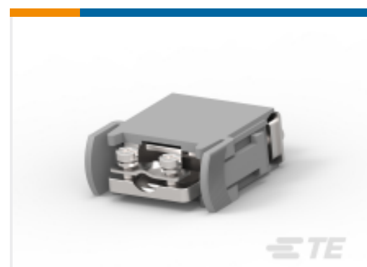
TE 产品编号T2111092201-007 HMN-009-F