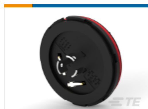
TE 产品编号1-2336396-1 ASSEMBLY, LIGHT CONTROLLER BASE, W/VENT