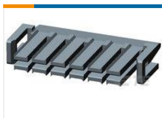
TE 产品编号2-1969541-8 RETAINER, TPA, DUAL ROW, EP2.5