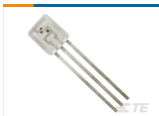
TE 产品编号11032254-00 EMITTER 660/940NM 1 2