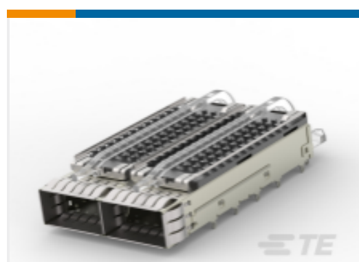
TE 产品编号2170808-1 QSFP28, 1X2, CAGE ASSY, SPRING, HS, LP