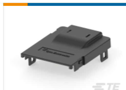
TE 产品编号 1986186-1 Strain Relief, 20 Posn, D3000 Dynamic, 2