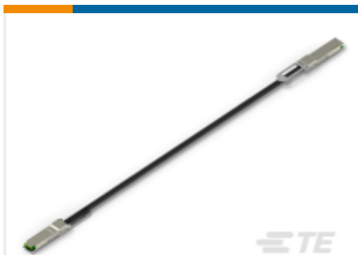
TE 产品编号 2333393-3 30 AWG QSFP28 对 QSFP28 电缆组件