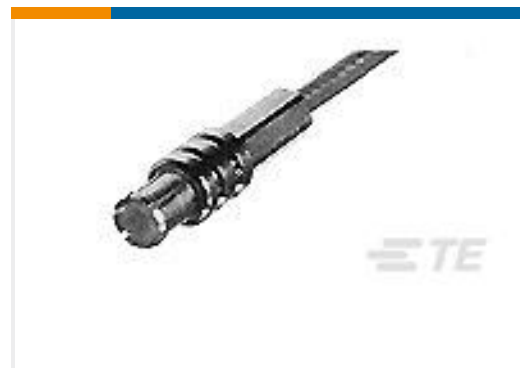
TE 产品编号 1060875-2 MCX CABLE PLUG, CRIMP ATTACH