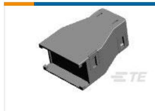
TE 产品编号 1986185-1 Strain Relief, 6 Posn, D5200 Dynamic, 2