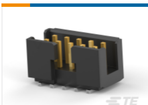
TE 产品编号 1-2373376-0 10P, 2MM, SHRD HDR, DRVT, SMD, 0.1 AU, TB