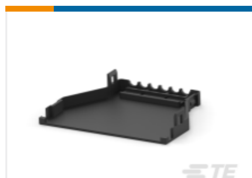
TE 产品编号 1776695-1 Strain Relief, D5200, Dynamic