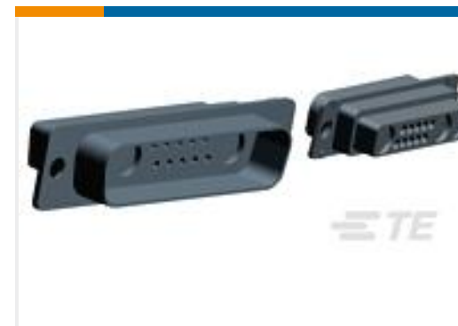
TE 产品编号 208810-2 PLUG ASSY, COAX MIX, AMPLIMITE