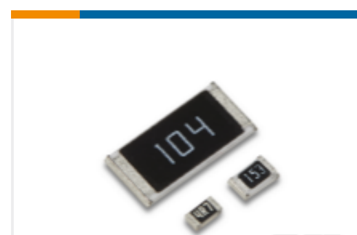
TE 产品编号2176337-2 CRGCQ 0402 12R 1%