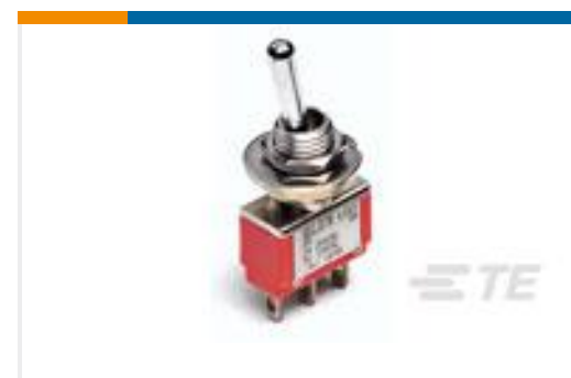
TE 产品编号2-1825138-2 A201SYAB04