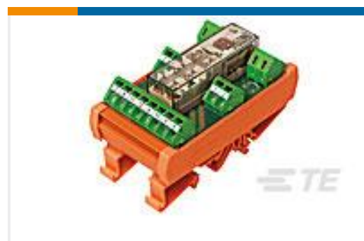
TE 产品编号6-1415046-1 SR6ZB615