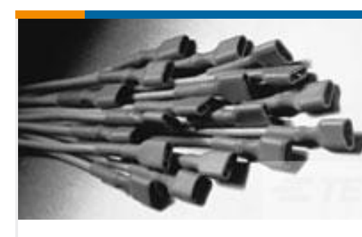
TE 产品编号6080774003 LSTT-19-4-SP