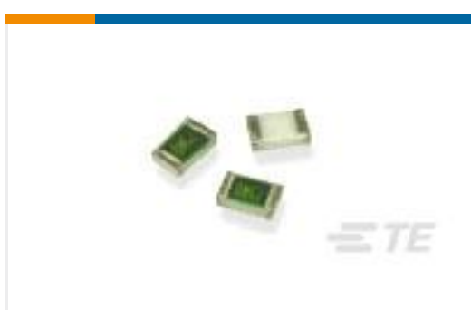
TE 产品编号7-1879131-0 RN 0402 10K2 0.1% 10PPM CUT LENGTH