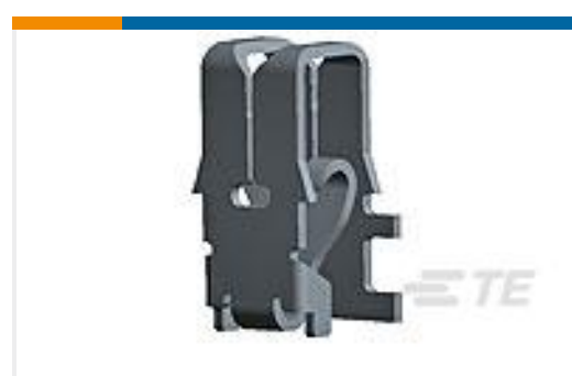
TE 产品编号63658-5 TERM,POKE-IN,MAG-MATE