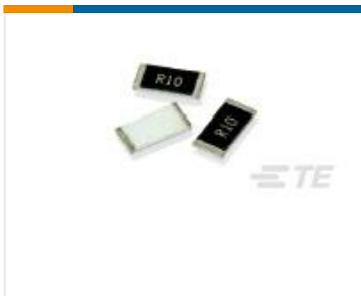
TE 产品编号1622825-2 RL73K 2A R15 5% 5K RL