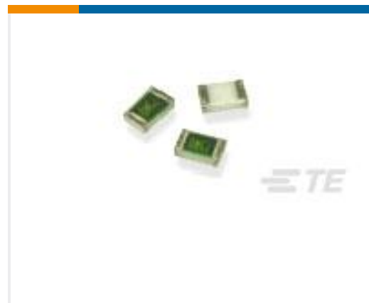
TE 产品编号1676157-2 RN 0805 113R 0.1% 10PPM 1KRL