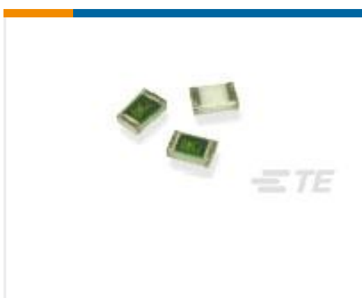
TE 产品编号1676229-2 RN 0805 1K33 0.1% 10PPM 1KRL