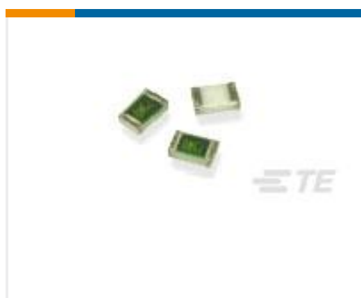
TE 产品编号1676451-2 RN 0805 86R6 0.1% 10PPM 1KRL