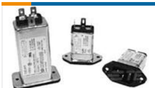
TE 产品编号1-6609008-3 10EJHP=F8050