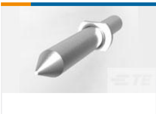
TE 产品编号1-223969-0 UNV PWR MDL, GUIDE PIN LOCT PL