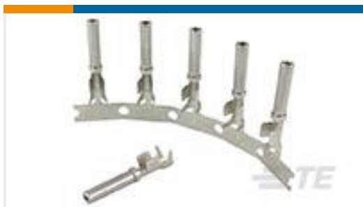
TE 产品编号1062-16-1222 SOC, SF, SIZE 16, 12-16, NI/SN