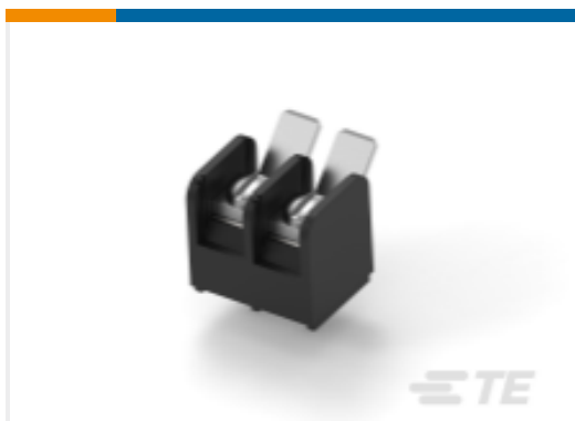
TE 产品编号1-1776249-1 JC6-P108-02-161=JC6-ASSY