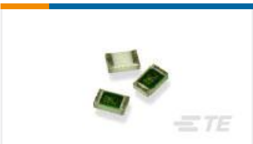
TE 产品编号1-1879215-0 CPF 0402 4K99 0.1% 25PPM 1K RL