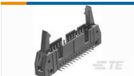
TE 产品编号1-499786-2 064 UNIV HDR RA 4S 15DP STD L1