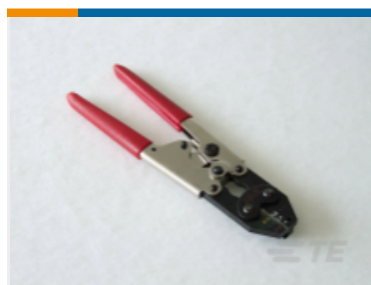
TE 产品编号 992008-000 AD-1377-CRIMP-TOOL-3-CVTY