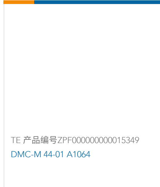
TE 产品编号ZPF00000000015349 DMC-M 44-01 A1064