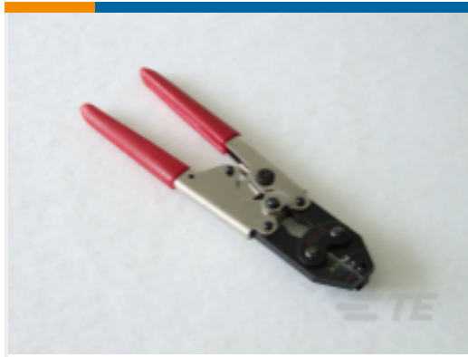
TE 产品编号 992008-000 AD-1377-CRIMP-TOOL-3-CVTY