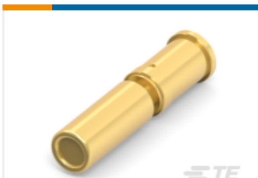
TE 产品编号60-0232-011-000 CONTACT SOCKET 3.6 MM