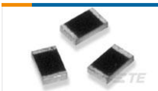
TE 产品编号8-1879254-8 RP 2B 46R4 0.1% 15PPM CUT LENGTH