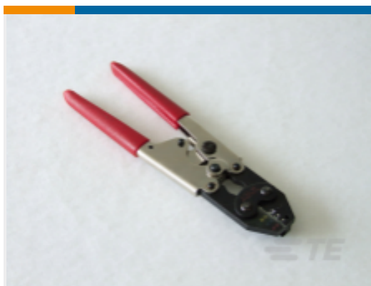
TE 产品编号 992008-000 AD-1377-CRIMP-TOOL-3-CVTY