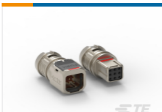
TE 产品编号YD369-MR66-NS10000 369 6 WAY SHIELDED REC, CRIMP, SKT