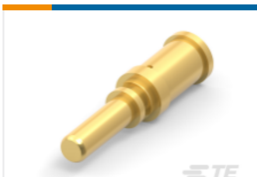
TE 产品编号61-0215-011-000 CONTACT PIN 3.6 MM