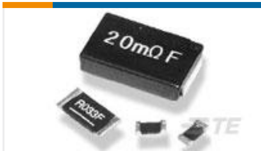
TE 产品编号3-1879378-5 TLR 2512 1.0W R006 1% 75PPM 2K RL