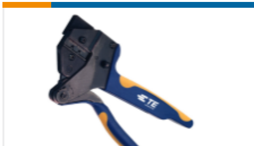
TE 产品编号2217266-1 SDE COMMERCIAL TOOL AND DIE