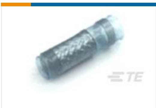
TE 产品编号372259-000 B-070-12-10