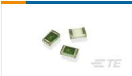
TE 产品编号4-1879131-6 RN 0402 8K45 0.1% 10PPM CUT LENGTH