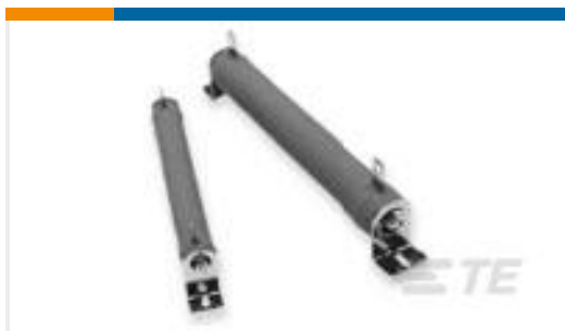
TE 产品编号1-1879451-8 TE 600W 27R 5% Bracket