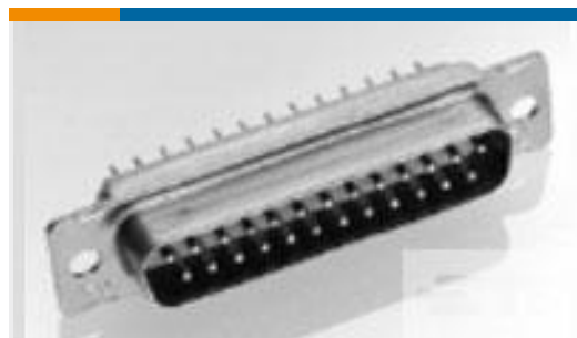
TE 产品编号1757820-1 AMPLIMITE,ASY,RCPT,STD,109,ZN,1