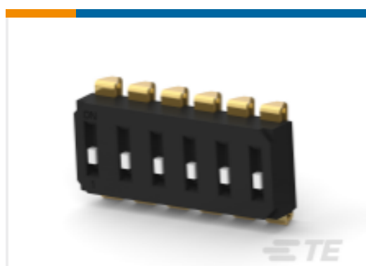
TE 产品编号1-2319848-6 END STACK DIP 6P J RECESS TUBE