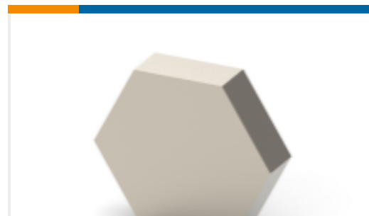
TE 产品编号1-330249-7 JAM NUT, PL