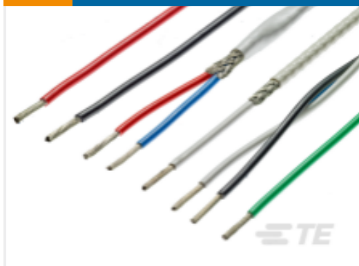
TE 产品编号 306409-000 44AM1141-20-0/2/5/9-9