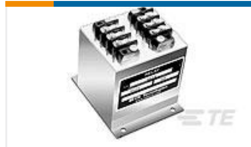
TE 产品编号 1618096-3 910-3X=WILMAR PHASE SEQUENCE