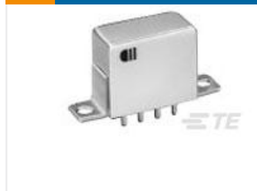
TE 产品编号 5-1617002-1 B07B112CC1 = RELAY.