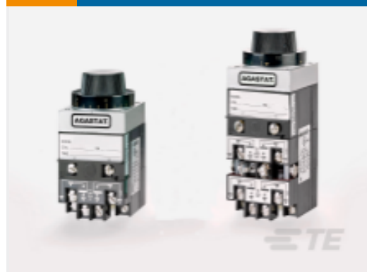
TE 产品编号 7-1423157-4 7012ACH4=RLY,STD,ON,2P,120VAC,