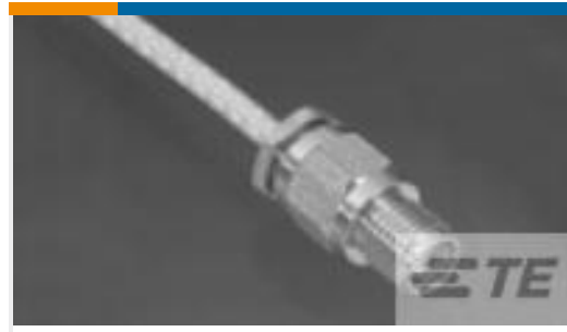
TE 产品编号 1050999-1 2004 7195 00