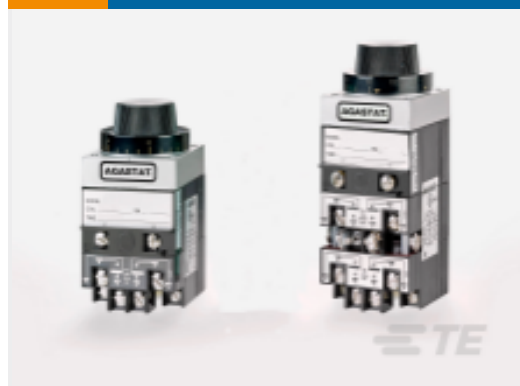
TE 产品编号 5-1423162-3 7022AAT=RLY,STD,OFF,2P,120VAC,