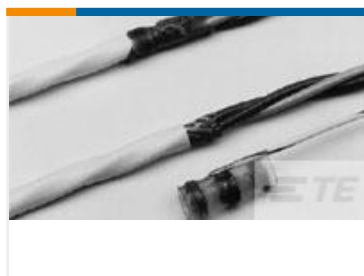
TE 产品编号 A74731-000 S200-2-W1-22-9