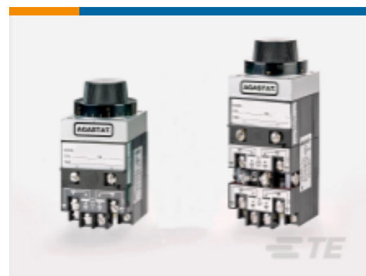
TE 产品编号 1755170-1 7022OCIM=RLY,STD,OFF,2P,24V,15S,I, M