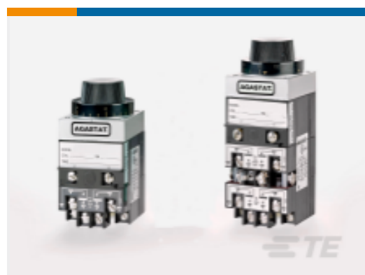
TE 产品编号 1-1423162-8 7022AK=RLY,STD,OFF,2P,120VAC,1