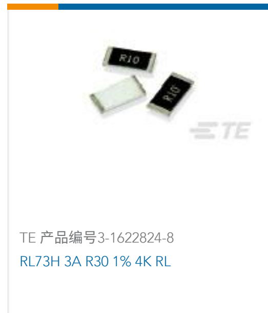
TE 产品编号3-1622824-8 RL73H 3A R30 1% 4K RL