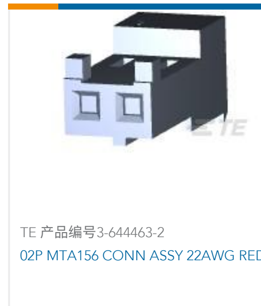
TE 产品编号3-644463-2 02P MTA156 CONN ASSY 22AWG RED