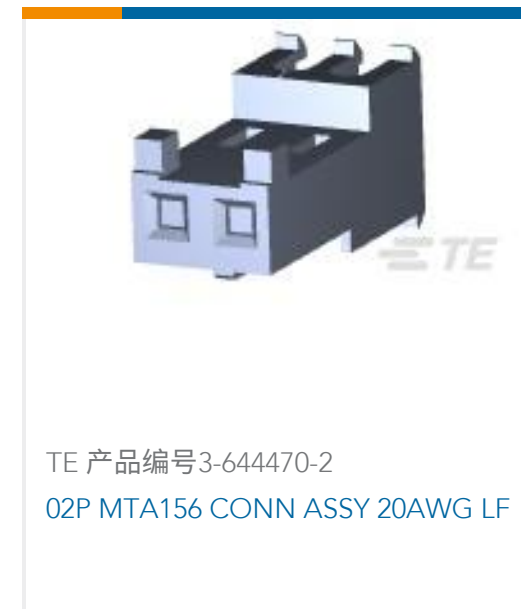
TE 产品编号3-644470-2 02P MTA156 CONN ASSY 20AWG LF