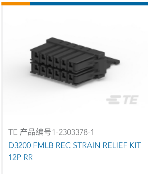
TE 产品编号1-2303378-1 D3200 FMLB REC STRAIN RELIEF KIT 12P RR