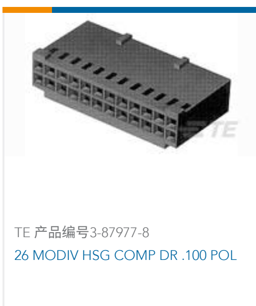
TE 产品编号3-87977-8 26 MODIV HSG COMP DR .100 POL