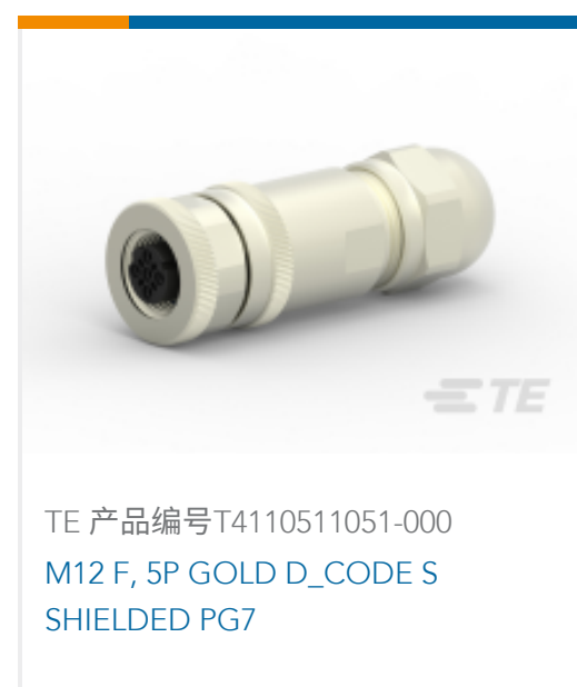
TE 产品编号T4110511051-000 M12 F, 5P GOLD D_CODE S SHIELDED PG7