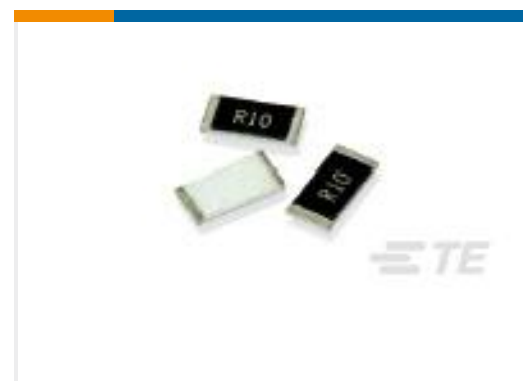
TE 产品编号3-1622824-8 RL73H 3A R30 1% 4K RL