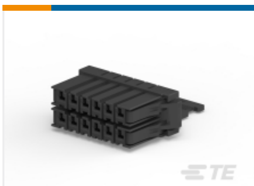
TE 产品编号1-2303378-1 D3200 FMLB REC STRAIN RELIEF KIT 12P RR