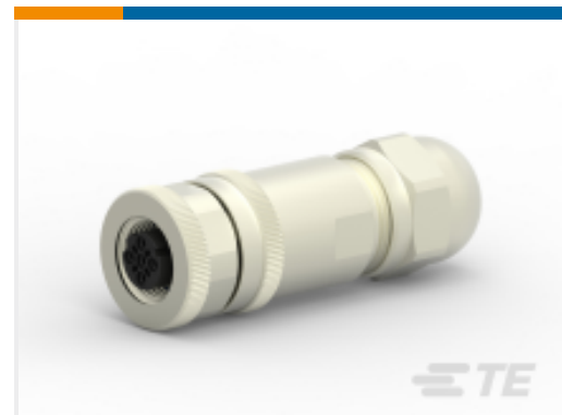
TE 产品编号T4110511051-000 M12 F, 5P GOLD D_CODE S SHIELDED PG7