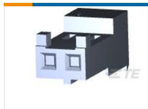
TE 产品编号3-644463-2 02P MTA156 CONN ASSY 22AWG RED