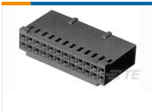
TE 产品编号3-87977-8 26 MODIV HSG COMP DR .100 POL