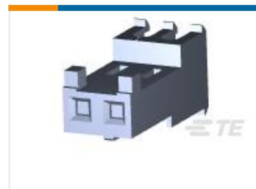
TE 产品编号3-644470-2 02P MTA156 CONN ASSY 20AWG LF