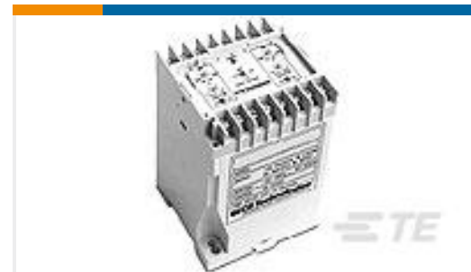
TE 产品编号2-1618058-8 WD5051-003=RELAY, OVERCURRENT