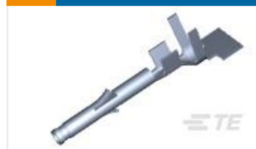
TE 产品编号171639-1 MINI U-M-N-L SOCKET L.P