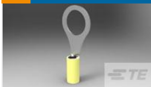
TE 产品编号8-35111-1 TERMINAL,PIDG R 12-10 5/16