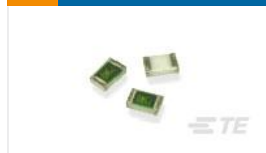
TE 产品编号1676221-2 RN 0805 1K0 0.1% 10PPM 1KRL