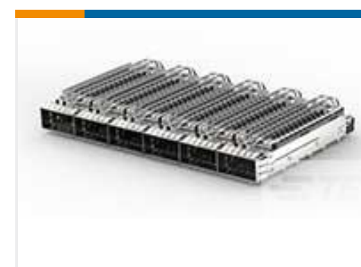
TE 产品编号2-2170708-1 CAGE ASSY, 1X6, QSFP28, SPRING, HS, LP