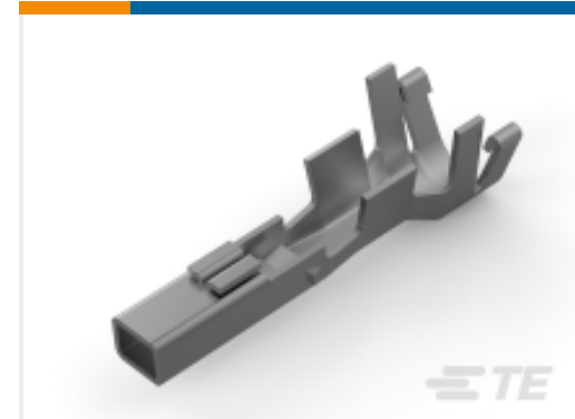
TE 产品编号177915-9 POWER DBL LOCK REC CONT