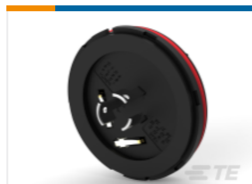
TE 产品编号1-2336396-1 ASSEMBLY, LIGHT CONTROLLER BASE, W/VENT