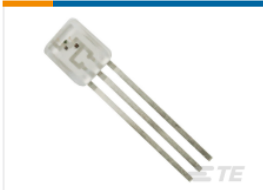
TE 产品编号11032254-00 EMITTER 660/940NM 1 2