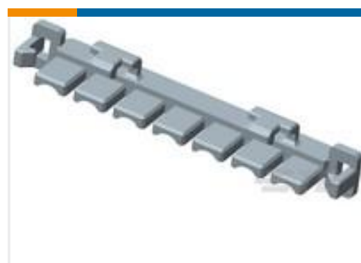
TE 产品编号1-1969609-2 12P VAL-U-LOK TPA 26-22 AWG