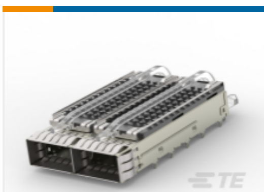
TE 产品编号2170808-1 QSFP28, 1X2, CAGE ASSY, SPRING, HS, LP