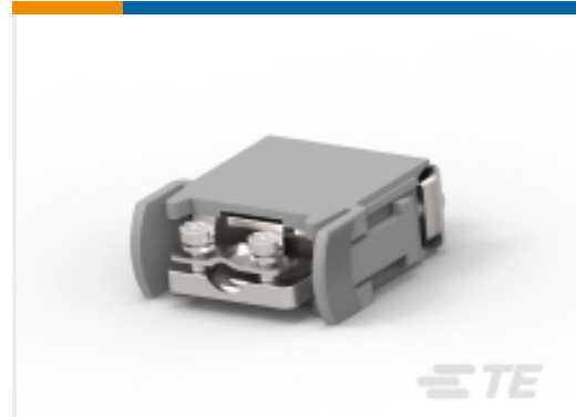
TE 产品编号T2111092201-007 HMN-009-F