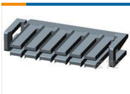
TE 产品编号2-1969541-8 RETAINER, TPA, DUAL ROW, EP2.5