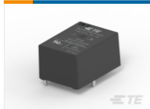
TE 产品编号1558662-4 T9GV2L14-15