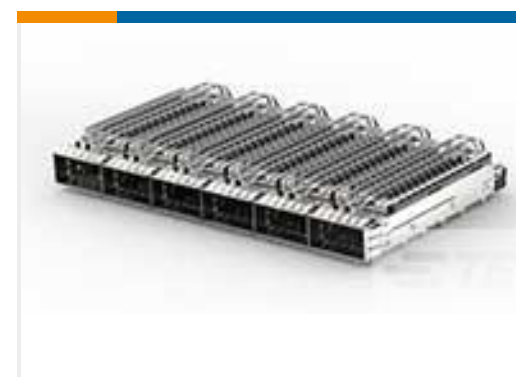
TE 产品编号2-2170708-1 CAGE ASSY, 1X6, QSFP28, SPRING, HS, LP