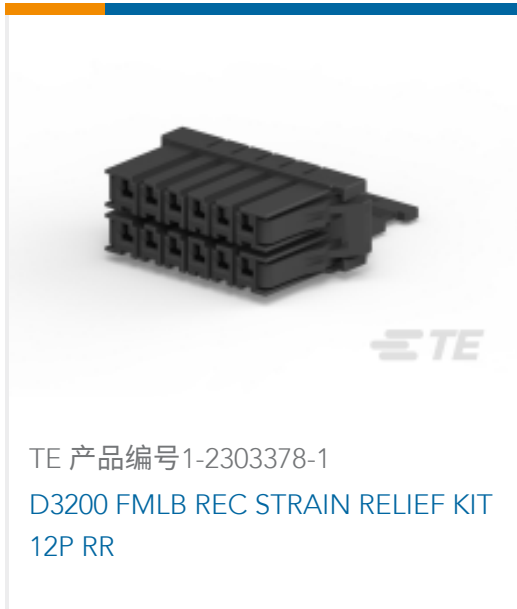
TE 产品编号1-2303378-1 D3200 FMLB REC STRAIN RELIEF KIT 12P RR