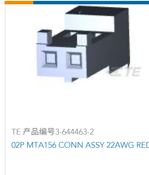
TE 产品编号3-644463-2 02P MTA156 CONN ASSY 22AWG RED