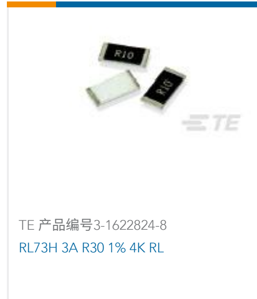
TE 产品编号3-1622824-8 RL73H 3A R30 1% 4K RL