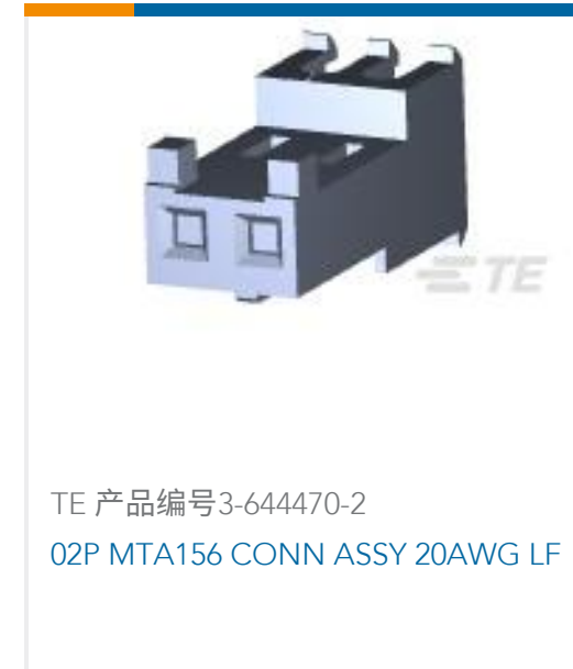
TE 产品编号3-644470-2 02P MTA156 CONN ASSY 20AWG LF