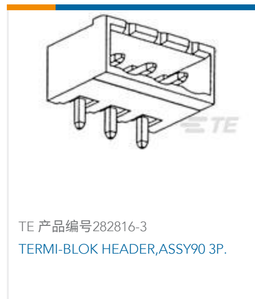
TE 产品编号282816-3 TERMI-BLOK HEADER, ASSY90 3P.