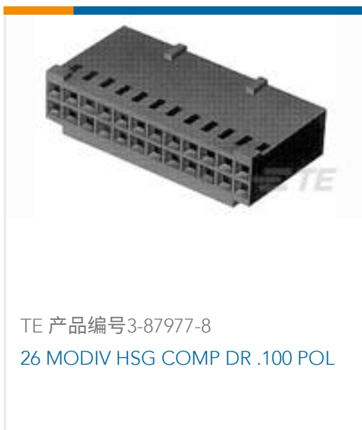
TE 产品编号3-87977-8 26 MODIV HSG COMP DR .100 POL