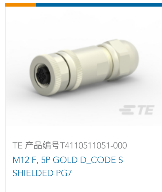
TE 产品编号T4110511051-000 M12 F, 5P GOLD D_CODE S SHIELDED PG7