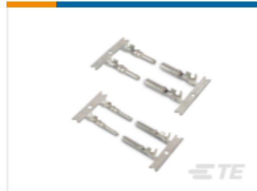
TE 产品编号1062-12-0222 DEUTSCH 冲压成型端子