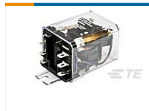
TE 产品编号1-1393115-4 KUIP-14A15-120=KU