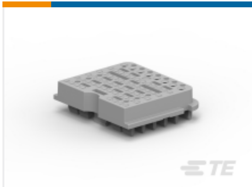
TE 产品编号WB-64SA WEDGE LOCK, 128P, PLG, GRY, DRB, A