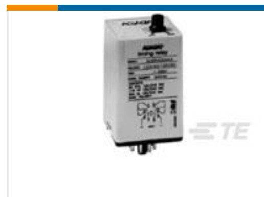
TE 产品编号1437463-4 SCRW21ABA=120V & 125VDC 0.5 TO