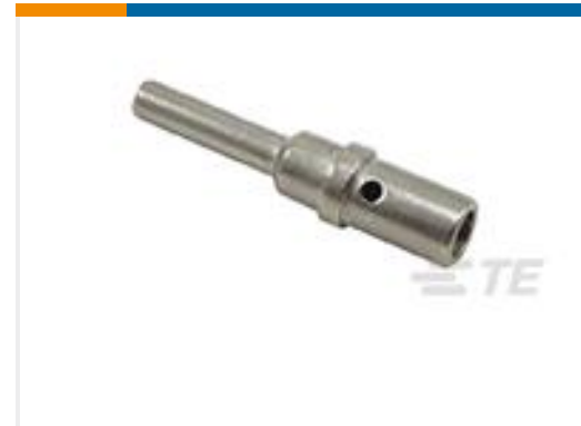
TE 产品编号0460-204-12141 PIN, SOLID, SIZE 12, 12-14AWG, NI