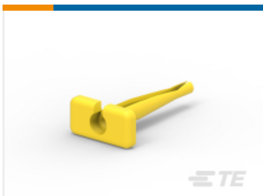
TE 产品编号114010-ZZ EXT TOOL, SIZE 12, 12 AWG, N, YEL