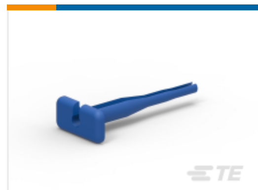
TE 产品编号0411-310-1605 EXT TOOL, SIZE 16, 16-18 AWG, T, LT BLU