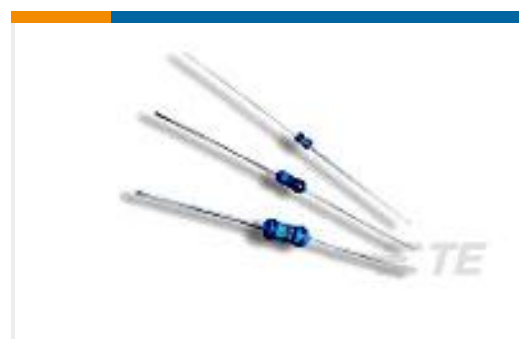
TE 产品编号1622738-1 LR2 1% 36K