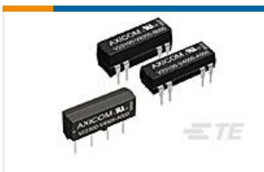
TE 产品编号2-1393763-3 V23100V4305C11