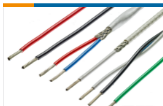
TE 产品编号3870603001 44A1111-26-9-0