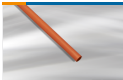
TE 产品编号EM63332001 BATTU-12.7/6.1-A1-3-STK