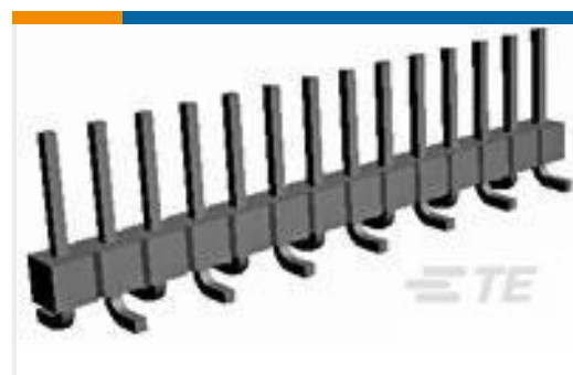
TE 产品编号1241150-6 6P MOD II BREAK AWAY HDR, SMD, BLISTER