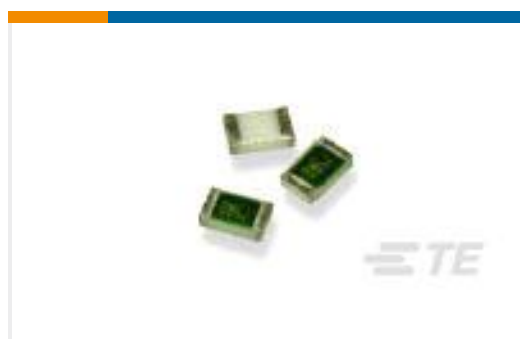
TE 产品编号5-1614964-6 CPF 1206 68R 0.1% 25PPM 1K RL