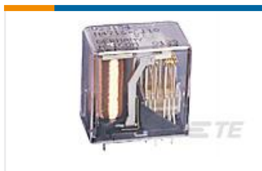
TE 产品编号4-1393808-7 V23154D 716F104